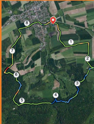
Grand parcours « Orange » ~8,9 km Départ rue du Cornat